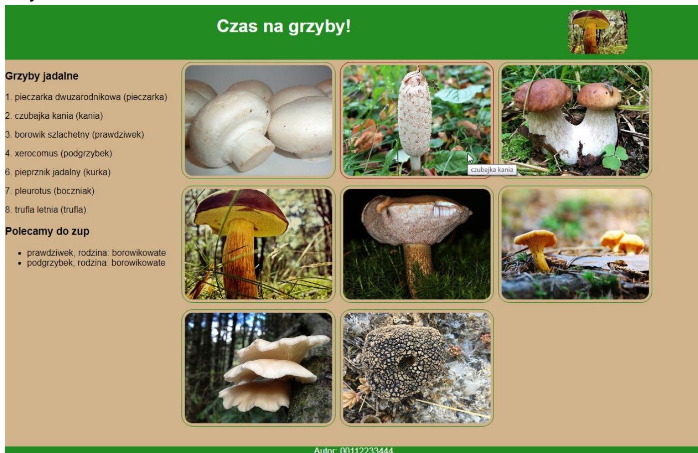
Obraz 2. Witryna internetowa. Kursor na drugim obrazie, zmieniony kolor obramowania oraz wyświetlony tekst „czubajka kania”.